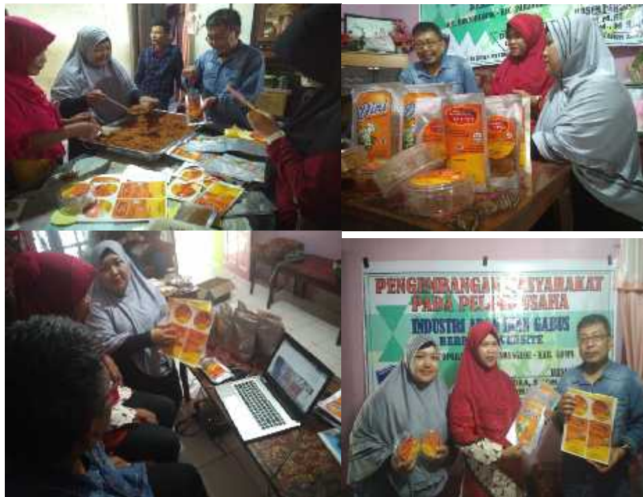
Gambar 4 Kegiatan Yang Dihasilkan