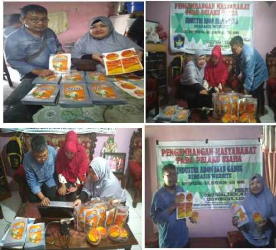
Gambar 2. Implementasi System