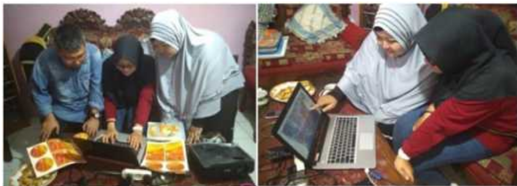
Gambar 1. Pelatihan Aplikasi Web Abon Ikan Gabus

Mengajarkan bagaimana mengoperasikan Aplikasi Web dan Bagaimana Memasarkan produk agar tertarik sistem pemasaran dengan media dapat memperluas jaringan pemasaran secara meluas dan dapat banyak pelanggan sistem informasi pemasaran dengan media berbasis online pemasarannya lebih cepat, tepat, akurat sesuai keinginan pembeli (Gambar 1).